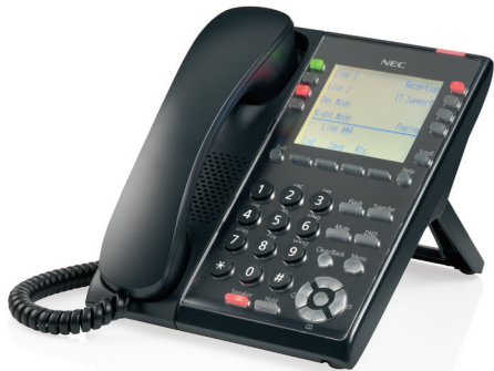
SL2100 IP 話機